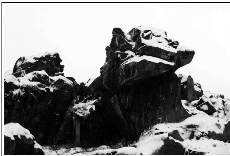
Рис. 36. Такие «стражи» охраняют вход в губу Долгая Щель.

Рудные проявления имеют романтические названия: „Анна“, „Раиса“, „Виктория“, „Эдвард“, „Самуил“, „Софья“ и др.».